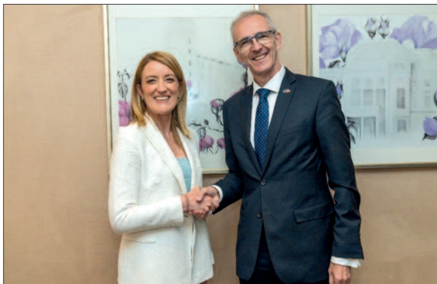
S predsedníčkou Európskeho parlamentu, Robertou Metsolou