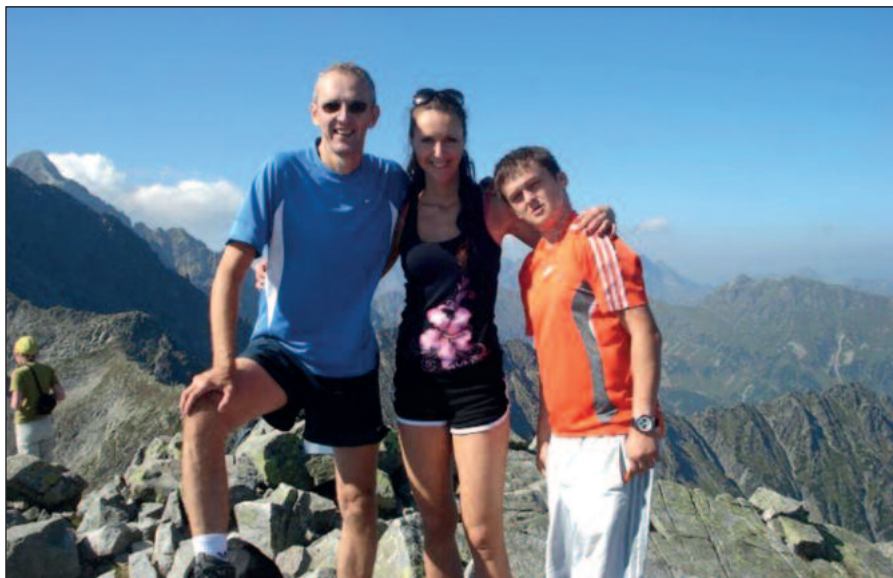
S deťmi na tatranských štítoch