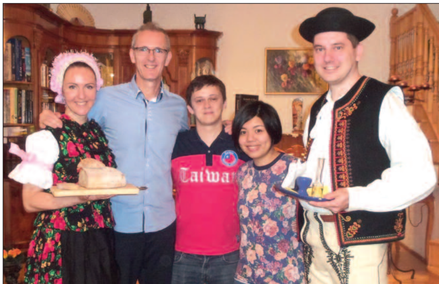
S dcérou, synom, nevestou a zaťom