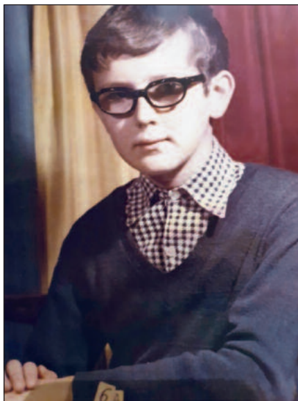
Ako žiak III.Základnej školy v Považskej Bystrici