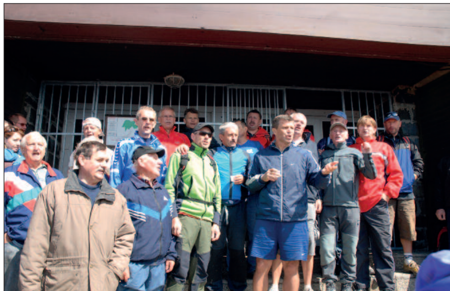
Najlepšie sa spieva „Na Kráľovej holi“ na Kráľovej holi