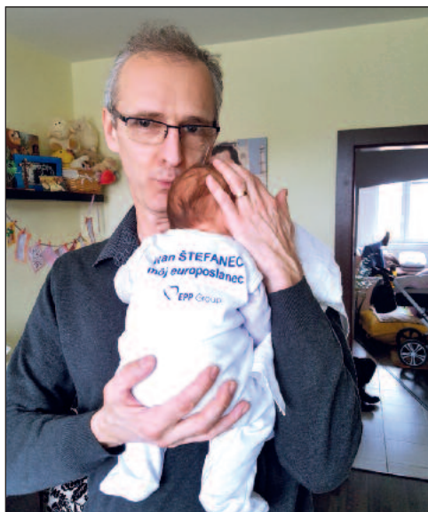
Sofinka ma urobila dedkom