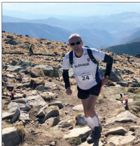
Pred cieľom horského behu Dotkni sa kríža pod vrcholom Ďumbiera