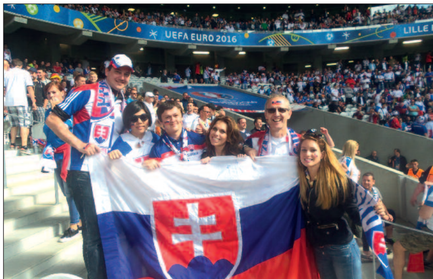
Fandíme na ME 2016 vo Francúzsku