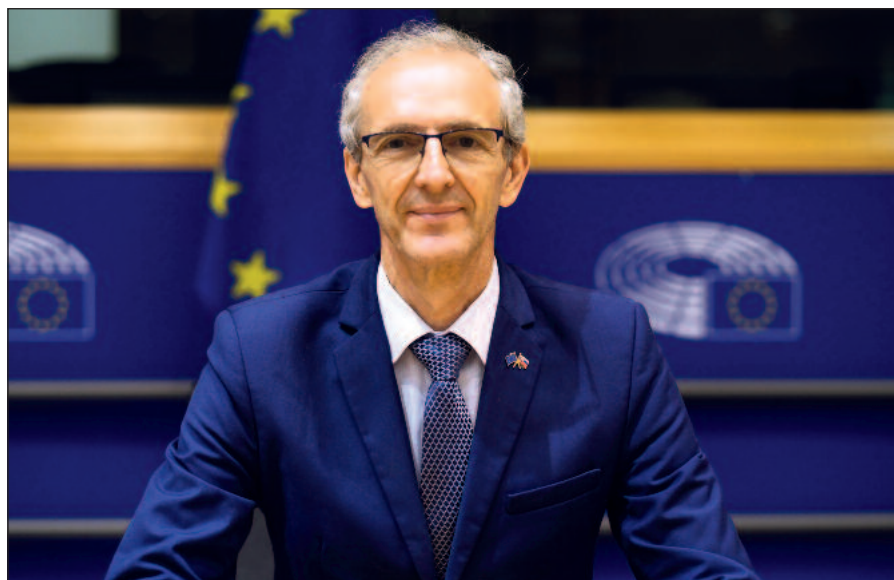
V europarlamentnom výbore