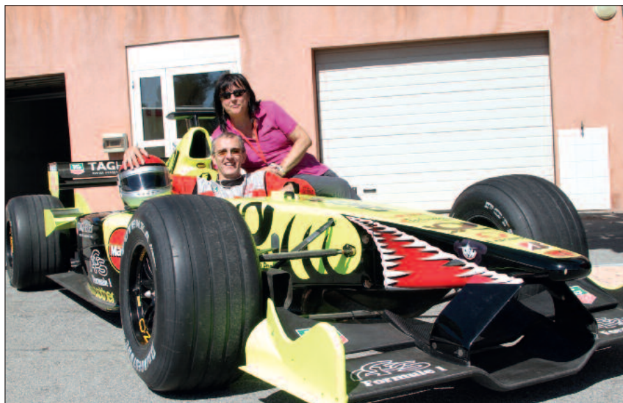
Zajazdiť si F1 bol vždy môj sen, ktorý mi splnila manželka