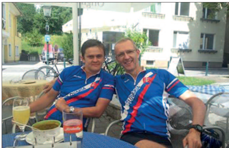
So synom na 1200 km cyklocesti z Bratislavy do Bruselu