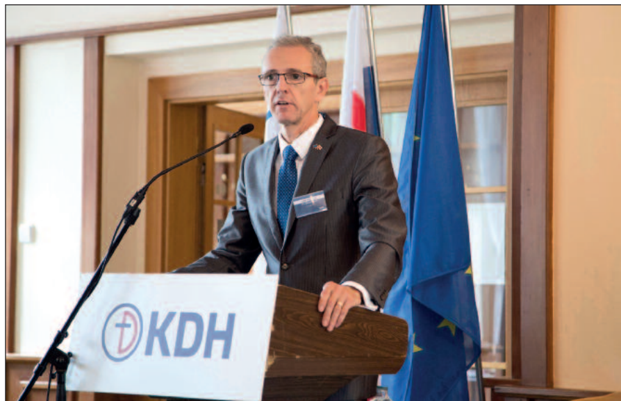
Na stránickej pôde