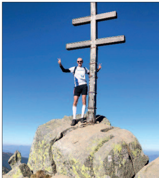
Na vrchole Ďumbiera