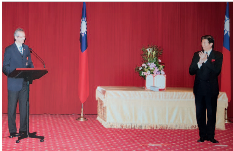
Pri preberaní vyznamenania Friendship Medal of Diplomacy v Taipei