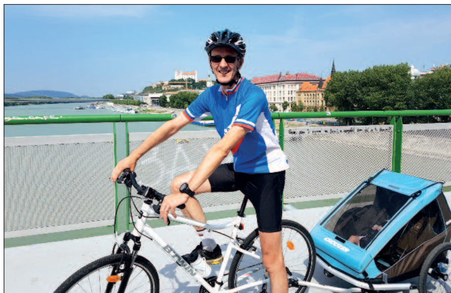
S vnučkou na cyklovýlete