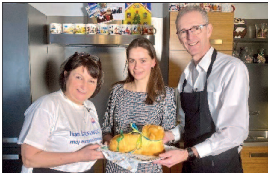
Pečenie baránka s kamarátkou a kolegýňou, českou europoslankyňou Miškou Šojdrovou