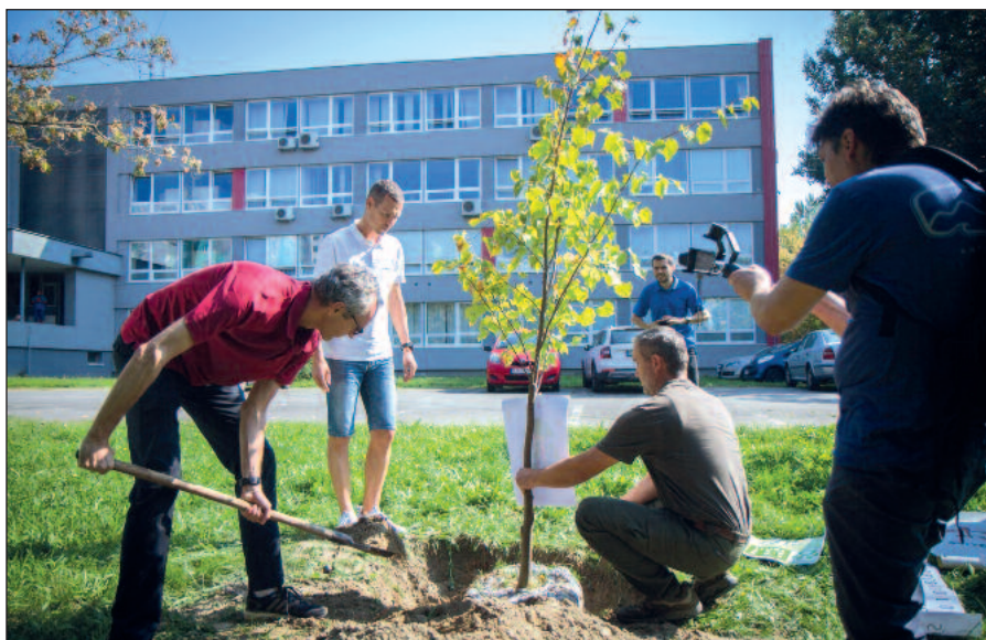
Pri sadení stromu v Petržalke s olympijským víťazom M. Tóthom