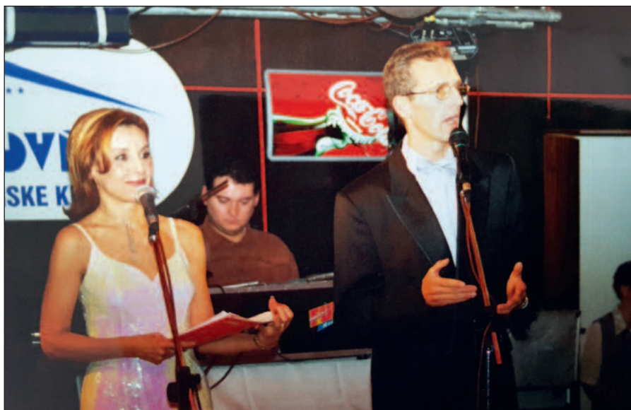
Ako generálny riaditeľ Coca-Cola Beverages Slovakia