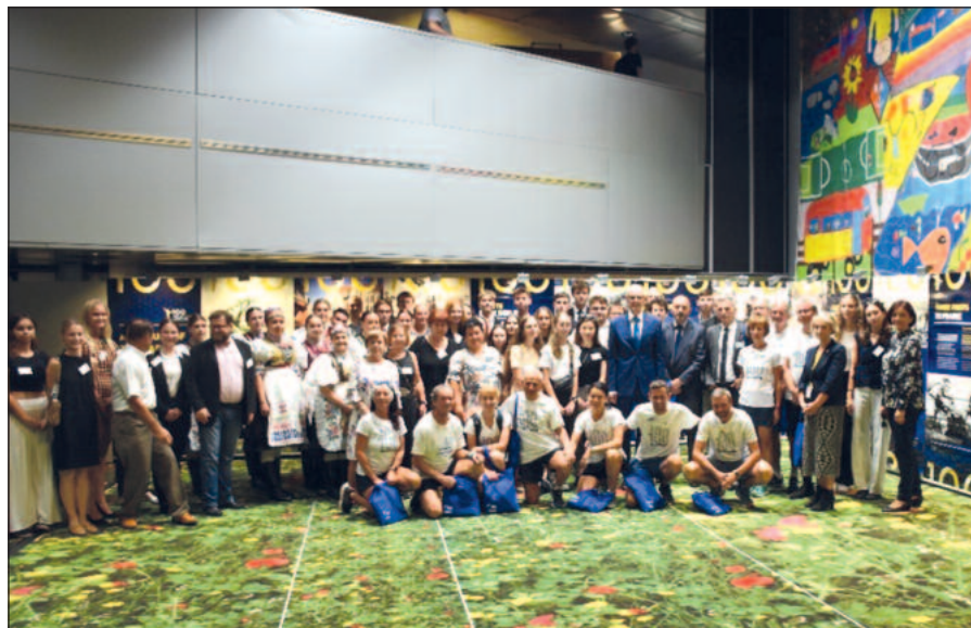
Na výstave k 100. výročiu Košického maratónu mieru v Štrasburgu, ktorý som organizoval v septembri 2023