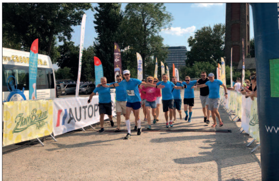
V cieľ behu Od Tatier k Dunaju s celým našim tímom