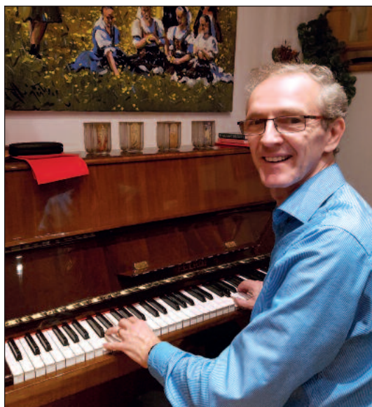
Občas si zabrnkám