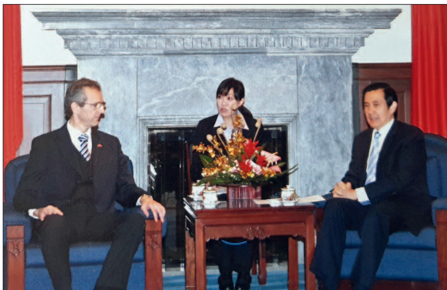
Pri jednaní s taiwanským prezidentom Ma