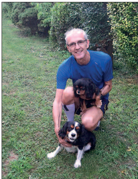
Doma so psíkmi