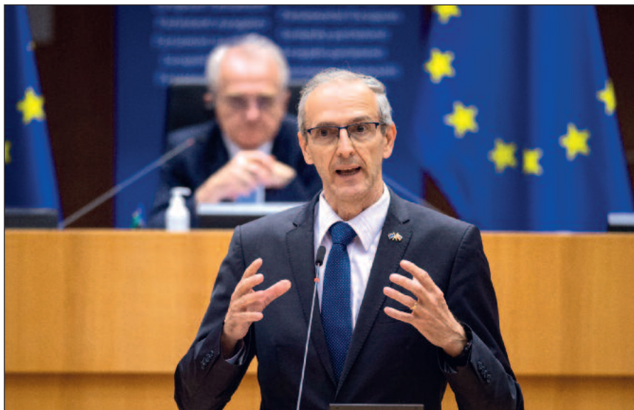
Pri vystúpení v pléne Európskeho parlamentu