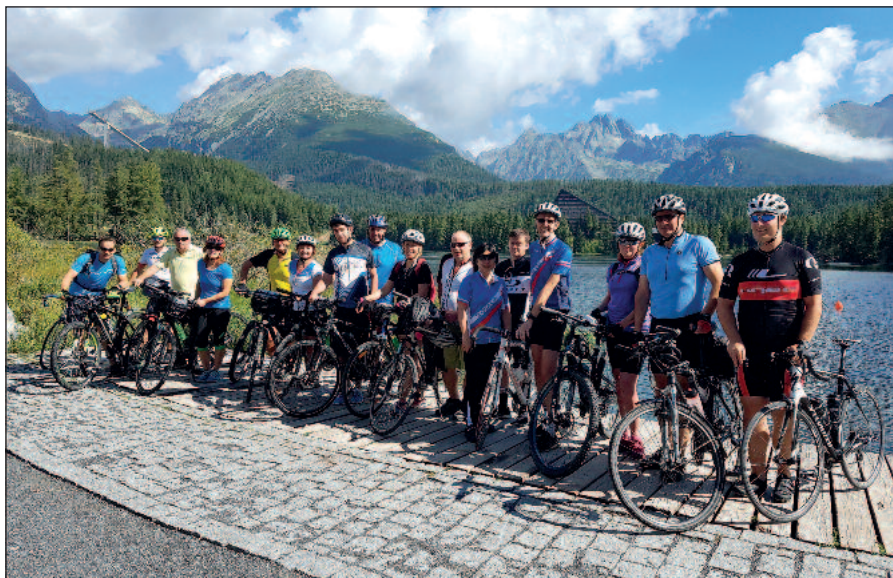
S priateľmi na cyklotúre Okolo Tatier