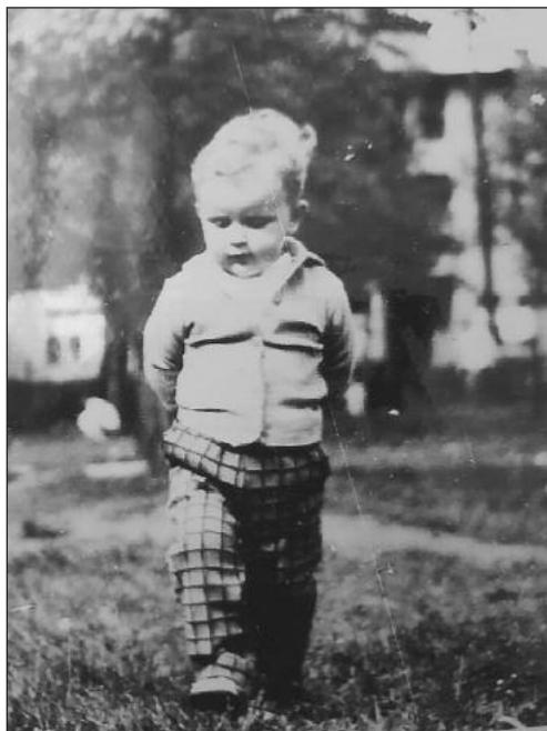
Rozmýšľanie o životnej ceste v Považskej Bystrici