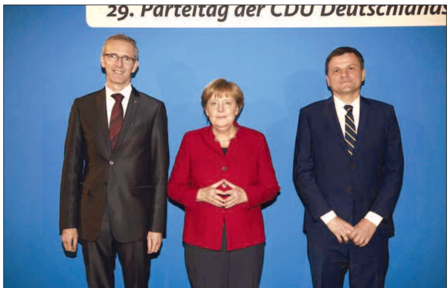
Na Kongrese CDU s kancelárkou A. Merkel a predsedom KDH A. Hlinom