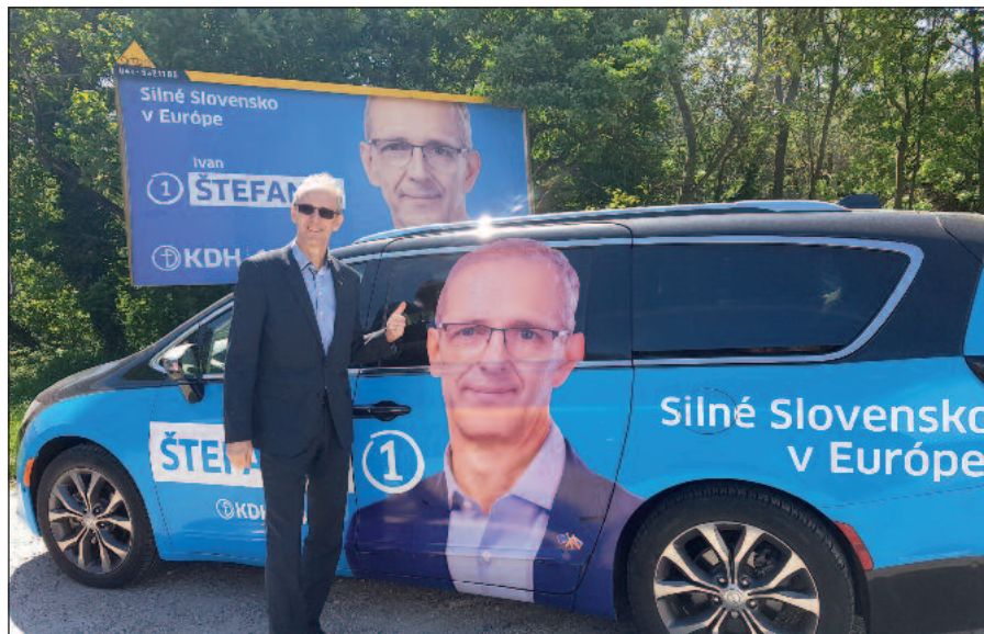
Strojenie pri volebnej kampani