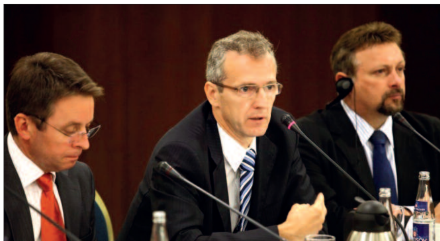
Na konferencii Americkej obchodnej komory