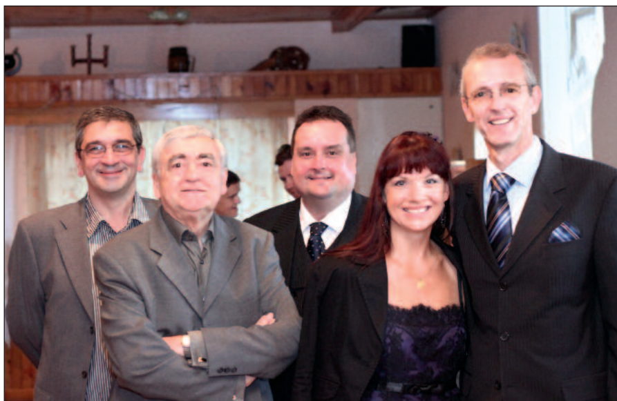
S priateľmi z RND, ktorých vždy rád stretávam