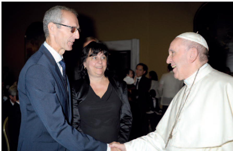
U Sv. Otca Františka vo Vatikáne