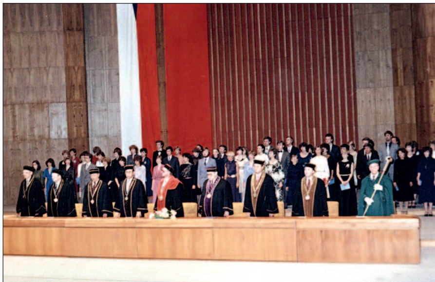
Na VŠE sme promovali spolu s budúcou manželkou