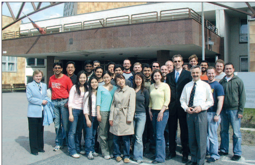
S nemeckými MBA študentami pred EÚ po pravidelných prednáškach