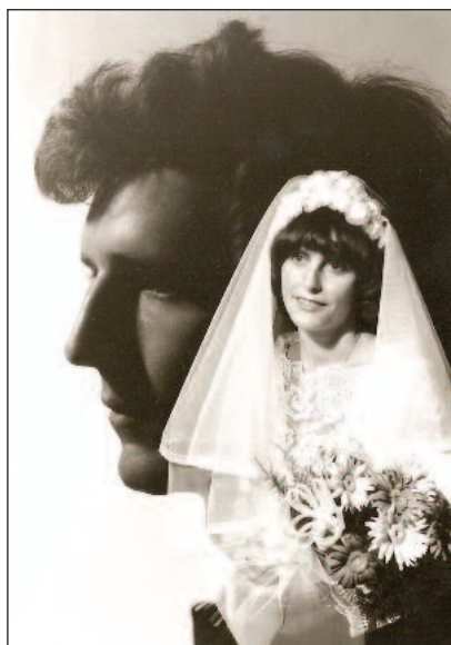
Dostala sa mi do hlavy a už tam zostala