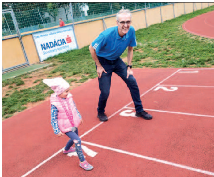
Bežecké tréningy s vnučkou