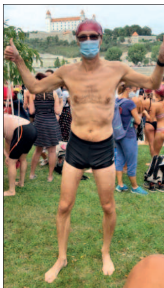
Ani pandémie nezabránila preplávaniu Dunaja