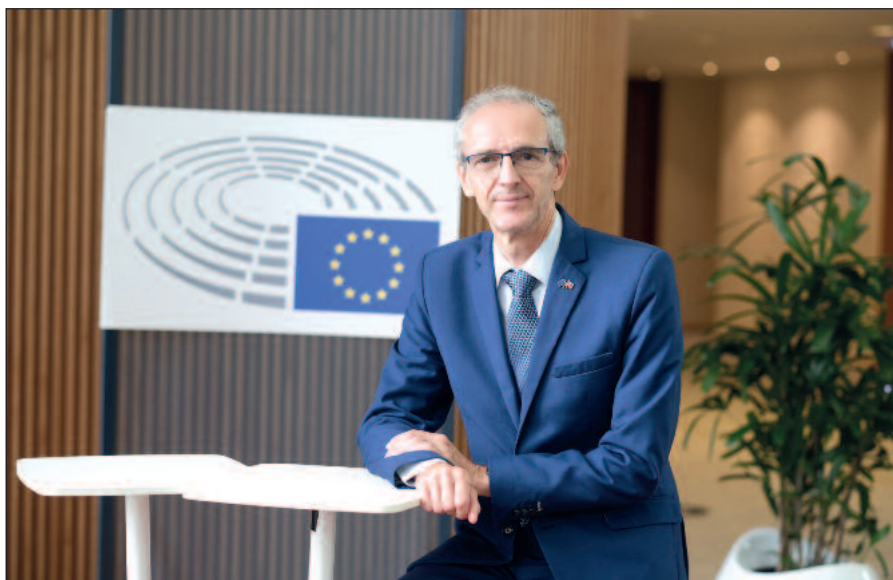
V Európskom parlamente