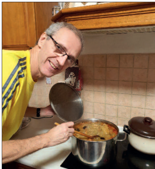
Kapustnicu podľa babkinho receptu varím rád a pravidelne