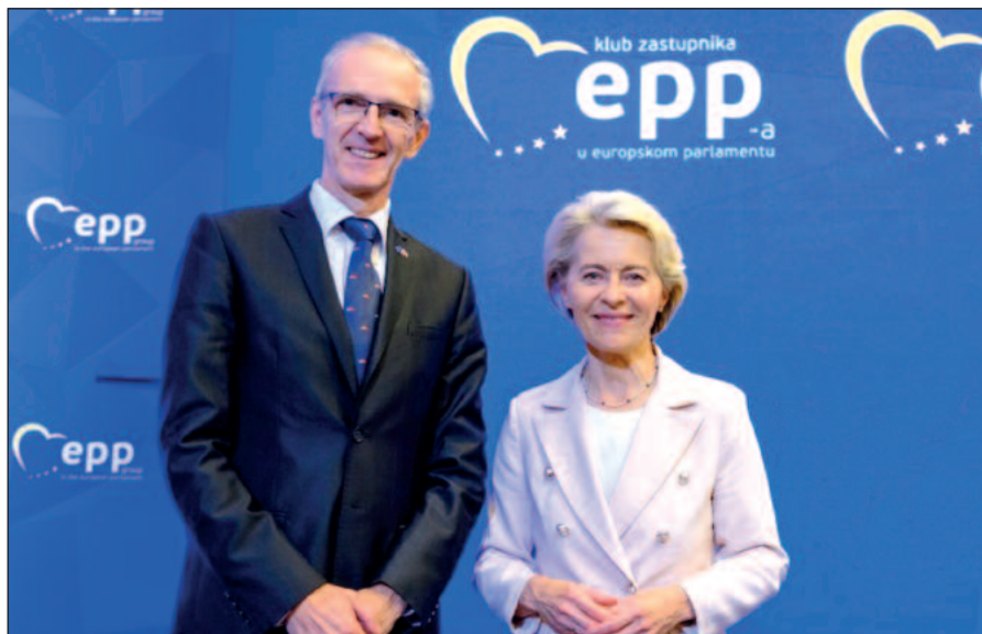
S predsedníčkou Európskej Komisie, Ursulou von der Leyen