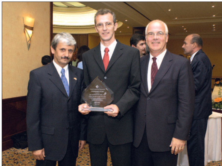
Pri odovzdávaní Dale Carnegie Leadership Award s predsedom vlády M. Dzurindom a predstaviteľom Dale Carnegie & Associates Inc.