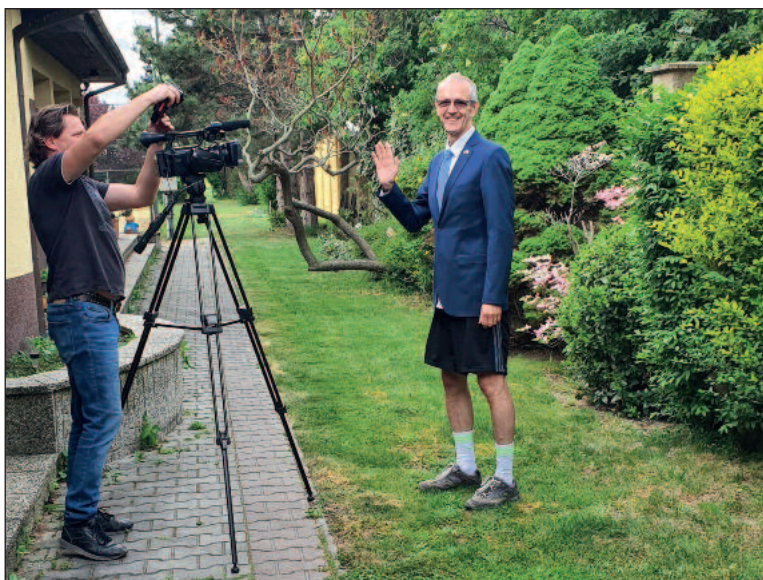
Ako sa robí televízny vstup