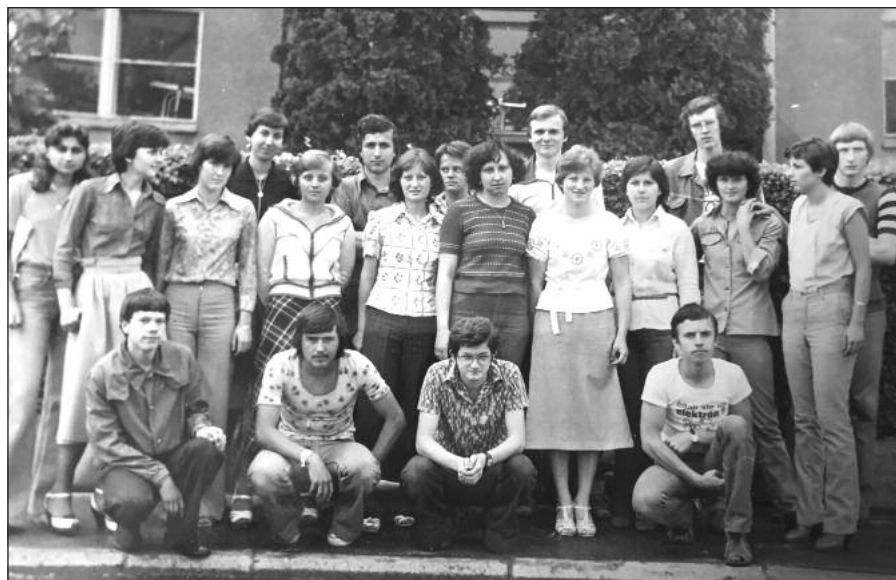
Z maturitného tabla Gymnázia v Považskej Bystrici