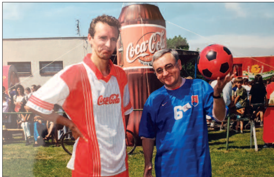
Kapitáni tímov po exhibičnom futbalovom zápase v Lúke