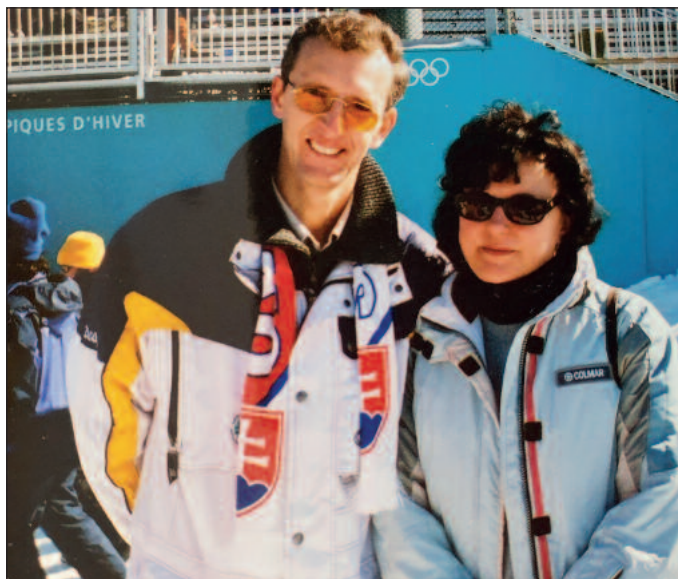
S manželkou na Zimnej Olympiáde