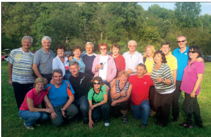
S otcovými súrodencami na Považí