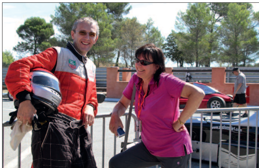
S manželkou pri jazde na F1