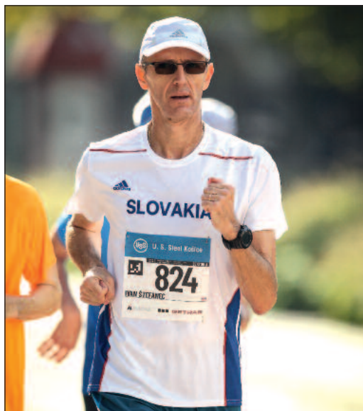
Na košickom maratóne