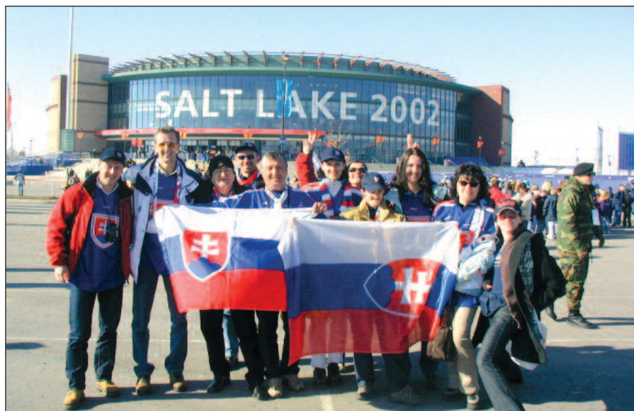
S priateľmi na ZOH 2002 v Salt Lake City