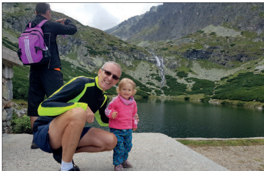
S vnučkou pri Velickom plese