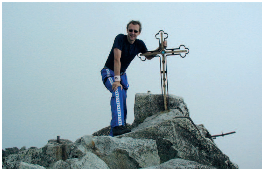
Na najvyššom bode Slovenska – vrchole Gerlachu