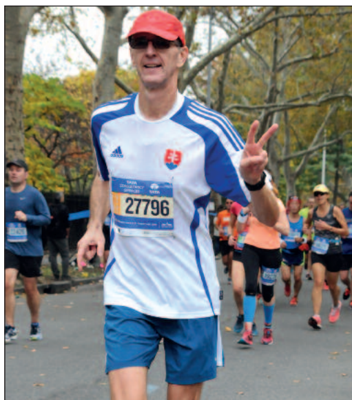
Na maratóne v New Yorku