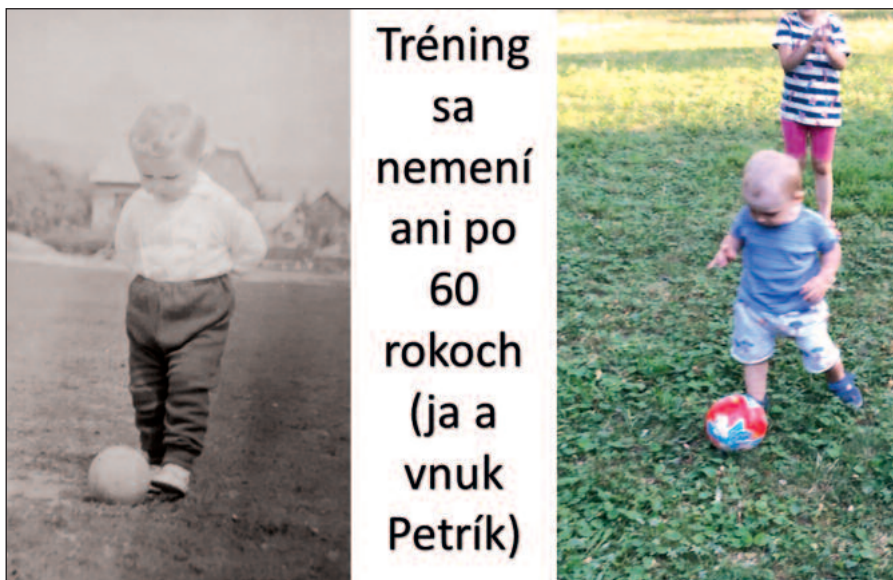
Podoby s vnukom