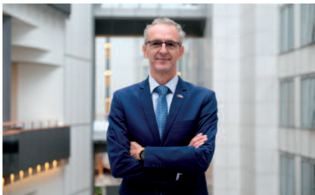
Ivan ŠTEFANEC Váš europoslanec