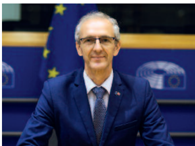
Ivan ŠTEFANEC Váš europoslanec